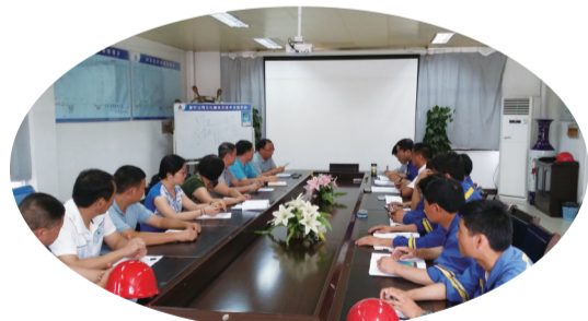
项目部与业主各部门召开开工协调会议

7月8日,挖掘机轰鸣作响,工人们热火朝天、干劲十足,由天津院承建的西安尧柏环保科技有限公司富平水泥窑协同处置废弃物工程总承包项目现场正式开工。